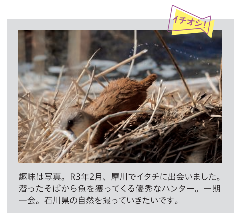
趣味は写真。R3年2月、犀川でイタチに出会いました。潜ったそばから魚を獲ってくる優秀なハンター。一期一会。石川県の自然を撮ってみたいです。

いのですが、これまではヤギを用いて、多ニューロン発射活動(Multi-unit activity: MUA)記録法によるGnRH PGの活動動態や影響する因子の探索を試みてきました。現在はラットでのMUA記録法確立を目指しています。