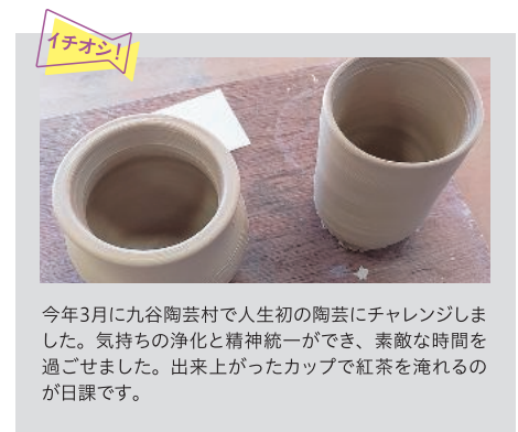
今年3月に九谷陶芸村で人生初の陶芸にチャレンジしました。気持ちの浄化と精神統一ができ、素敵な時間を過ごせました。出来上がったカップで紅茶を淹れるのが日課です。

今後は、アンダーウェアの効果を産後の母親から評価することで身体への効用を把握し、将来的には開発した産前産後の全機能一体型アンダーウェアを子育て支援・女性の社会での活躍推進など幅広いサポートに役立てたいと考えています。