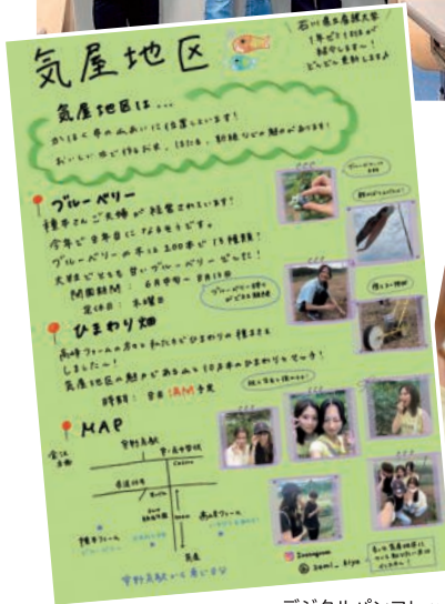
デジタルパンフレット