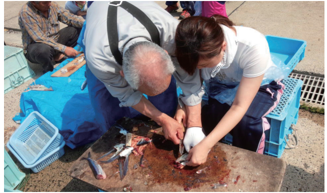
1年生フィールド実習(能登町民泊)