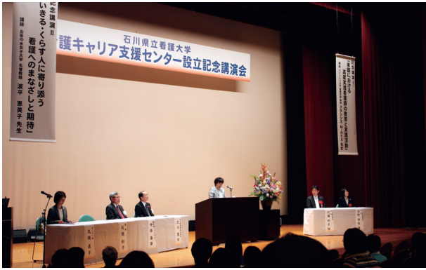
附属看護キャリア支援センター設立記念講演会