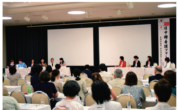
日中韓看護フォーラムいんいしかわ開催