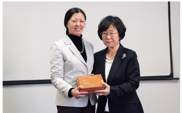
中国吉林看護学院大学と提携覚書(MOU)締結