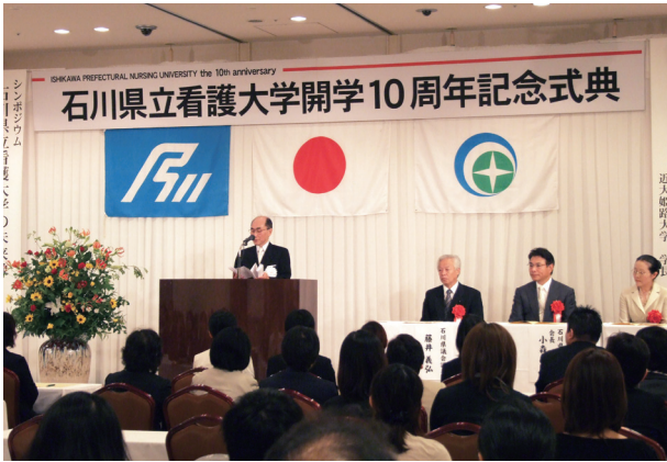
開学10周年記念式典