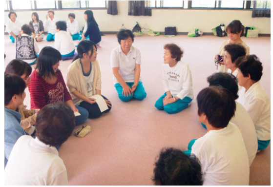
ヒューマンヘルスケア人材育成プロジェクト(能登町)