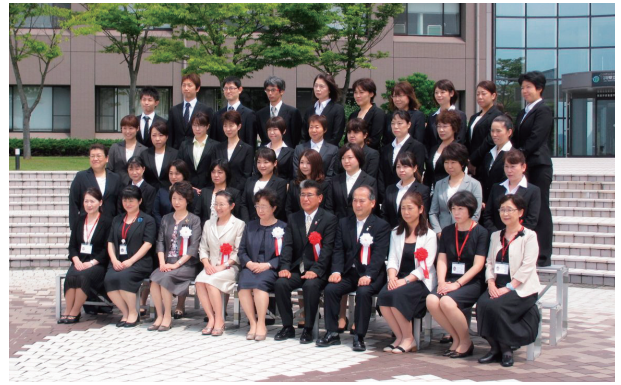
附属看護キャリア支援センター 感染管理認定看護師教育課程開講式(第1期生)