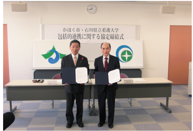
かほく市との包括的連携に関する協定締結