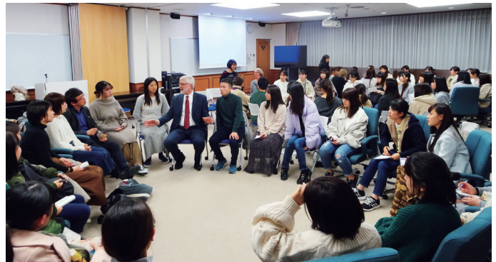
国際看護情報交換会