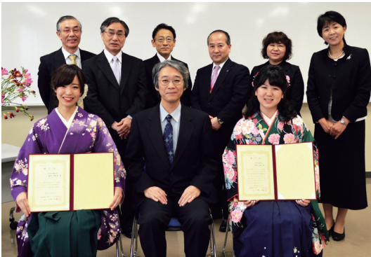
学都石川課題解決型グローバル人材育成 プログラム修了証授与式