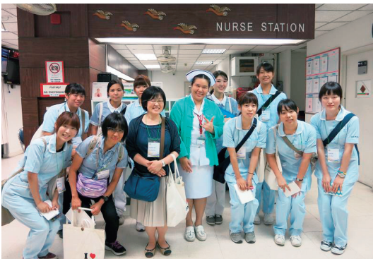
タイ国立チェンマイ大学看護研修