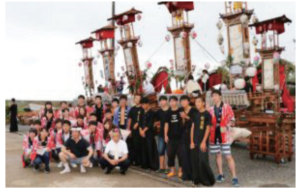
「能登・祭りの環」インターンシップ事業 能登町矢波諏訪祭