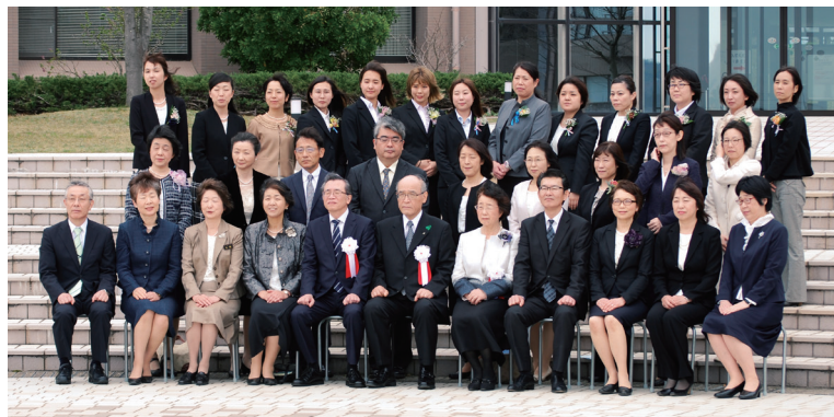
入学式 大学院看護学研究科博士 前期課程助産師養成課程開設