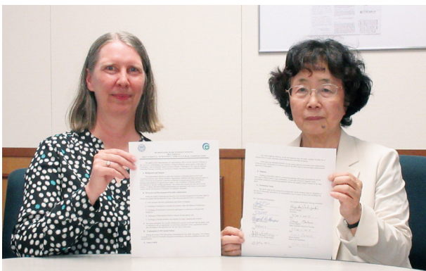
ワシントン大学との学術協定更新