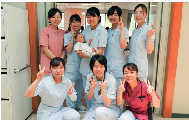
オープンキャンパス