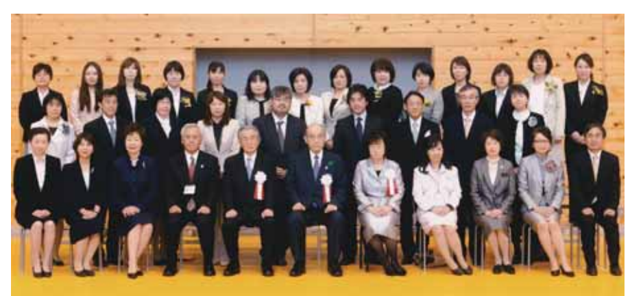
第 15 回入学式 (平成 26 年 4 月 4 日)