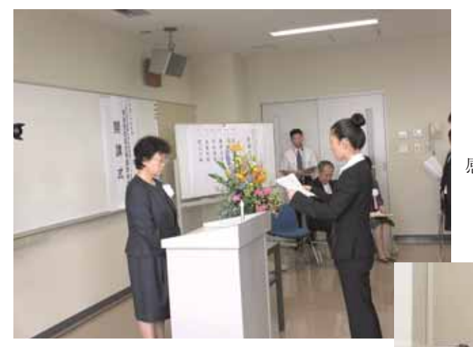
感染管理認定看護師教育課程の開設 (開校式 平成26年7月16日)