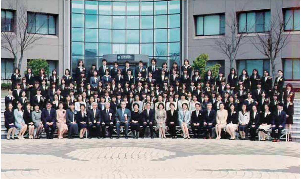
第 13 回入学式（平成 24 年 4 月 6 日）