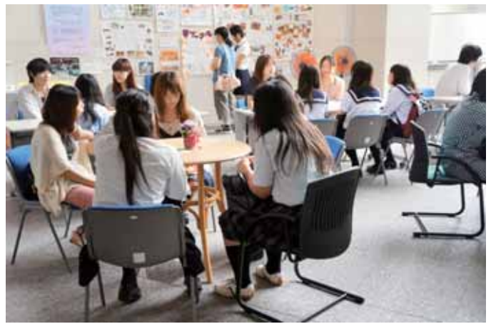
オープンキャンパス（平成 24 年 7 月 21 日）