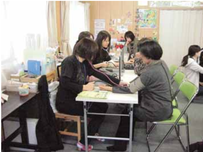
被災地ボランティア活動