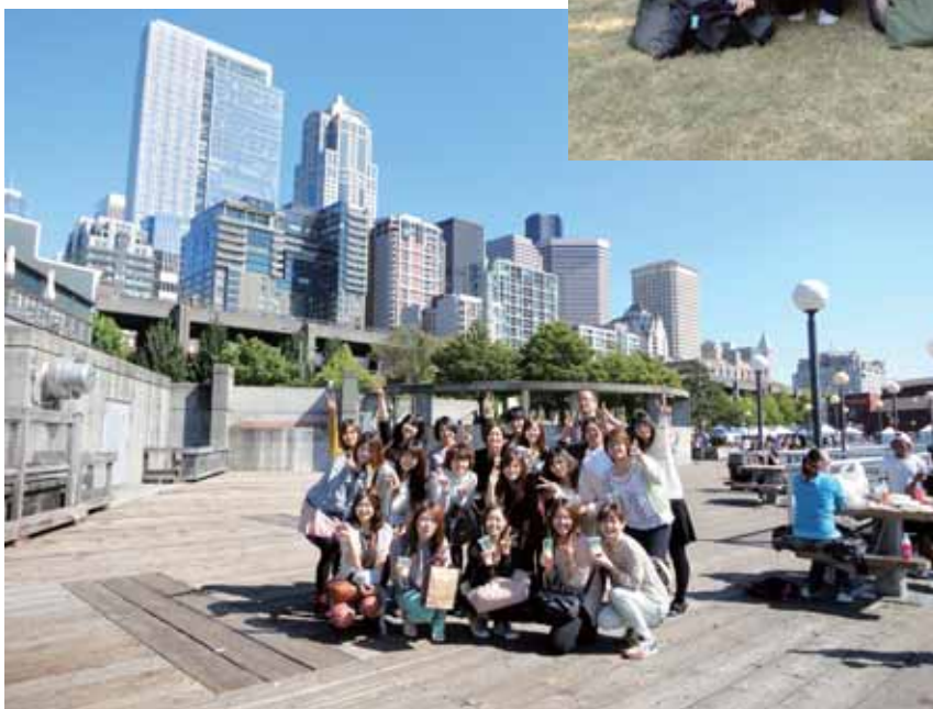
第 7 回夏季アメリカ看護研修（平成 24 年 8 月 28 日～9 月 6 日）