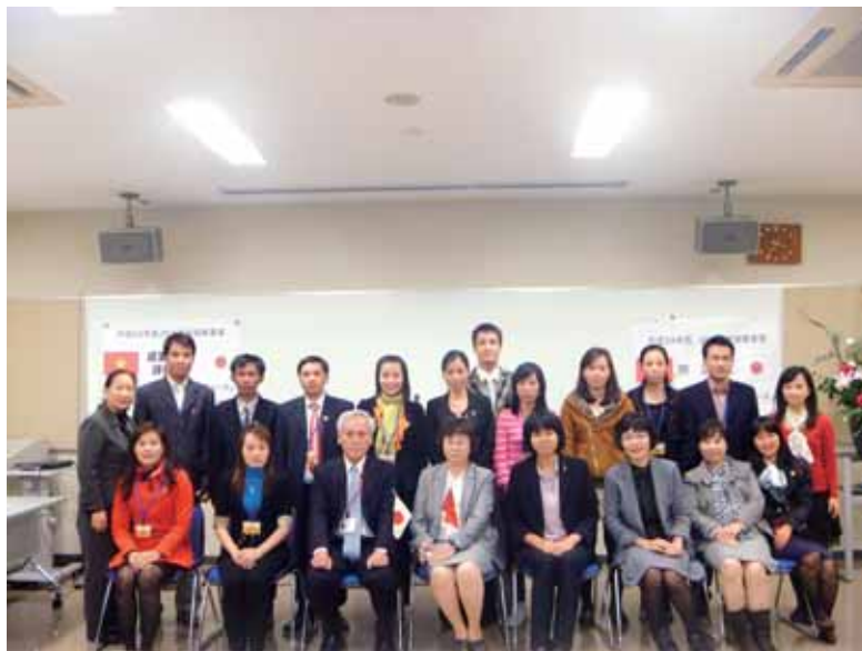
JICA ベトナム青年研修 （平成 24 年 10 月 25 日～11 月 6 日）