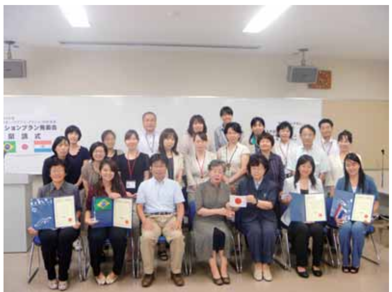
JICA 日系研修 （平成 24 年 7 月 16 日～8 月 9 日）