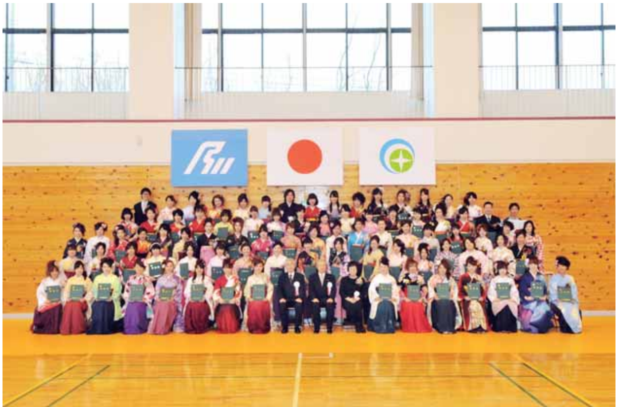
第10回卒業式（平成25年3月16日）