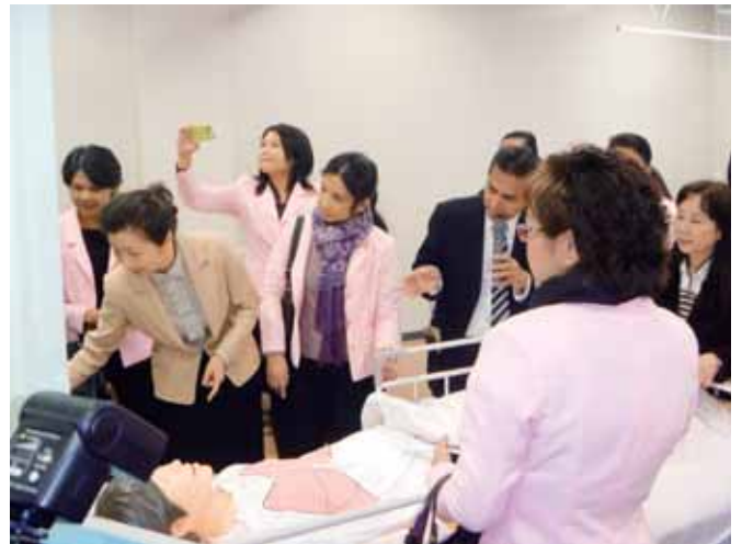
タイ王国ナコーンシータマラート県 ボロオンマラートチョンナー看護大学の交流会（平成 24 年 4 月 3 日）