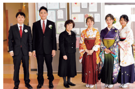
学長表彰を受けた皆さん