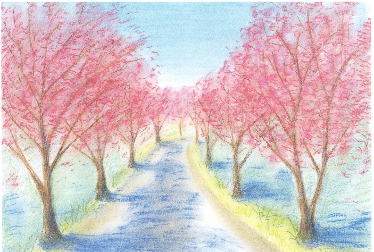
『さくら』(宝達登山道) でらうち てつじょう パステル画/寺内 徹乗(第1期生)